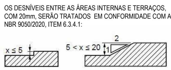
Figura 68 - Tratamento de desníveis